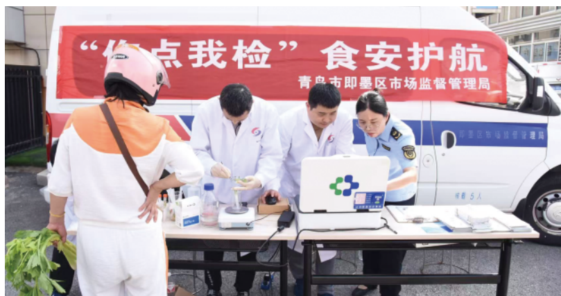
实施系列惠民利民举措,开展食品安全“你点我检”活动。

标准示范引领。鼓励指导企业参与制定国家标准35项、行业标准7项;新培育10家企业立项市级标准化试点,协助2个国家级、2个省级试点通过验收,