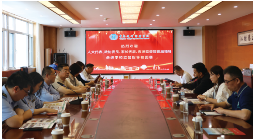
邀请部分人大代表、政协委员及市民代表走进学校监督指导“校园餐”安全。