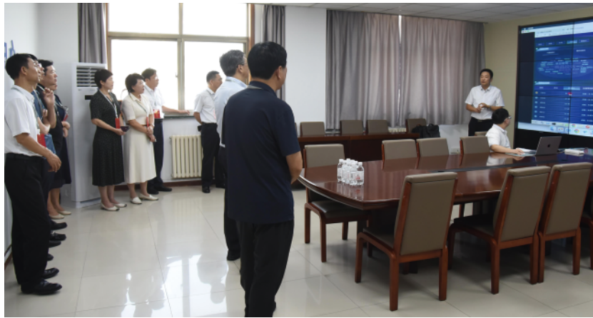
创新投诉举报处置系统,问题解决率、群众满意率大幅提升。图为区人大组织部分委员参观智慧监管平台。