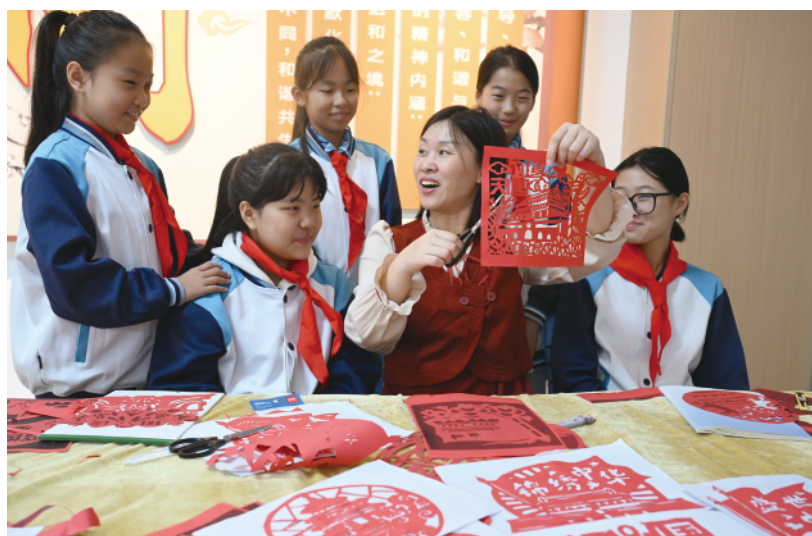
老师在教学生创作以“迎国庆”为主题的剪纸作品。

该校相关负责人介绍,剪纸是国家级非遗,此次活动既让学生零距离感受传统艺术魅力,又通过红色主题创作厚