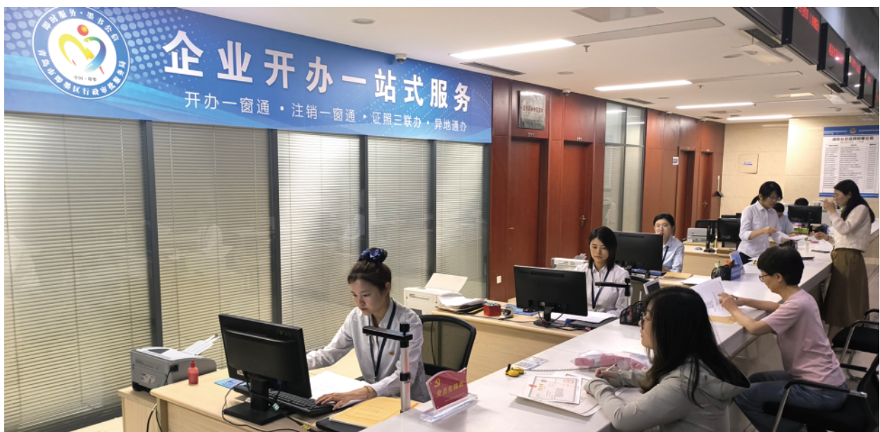
工作人员有序推进经营主体登记工作。

2025年,区行政审批服务局将以“两抓四维五化”为抓手持续发力,纵深推进行政审批服务各项工作,为全区高质量发展贡献审批力量。(区行政审批服务局)