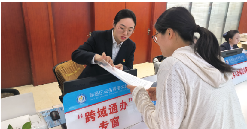
即墨小政为群众提供现场咨询解答和申请材料指导。

(经营场所)登记便利化,建立我区地址标准库,开展企业智能表单登记改革。探索“个转企”改革,申请材料精简50%,办理环节压缩75%,助力市场主体快速转型升级。圆满完成“一机一码”省级试点验收。推动游戏游艺设备“一机一码”审批服务,助力游戏游艺市场规范化、标准化、信息化。