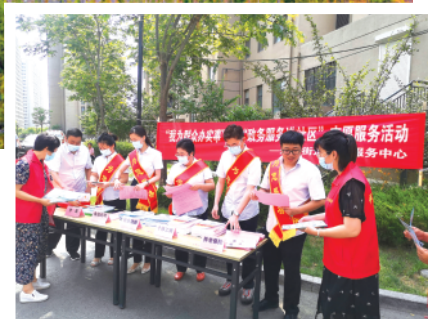
“政务服务进社区”志愿服务活动